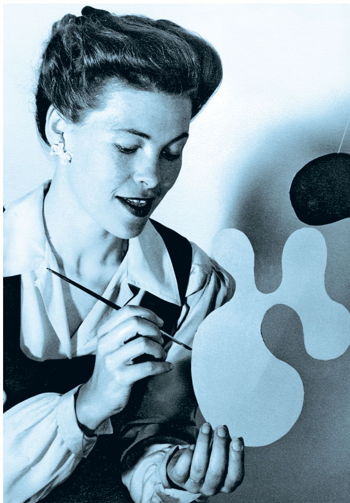
Ray Eames travaillant sur un mobile, années 1940.

Au début des années 1940, Charles et Ray Eames ont mené une série d'expériences afin d'améliorer leur technique de moulage du contreplaqué. Ces recherches ont abouti à la création d'un objet dont les contours biomorphiques rappellent fortement les dessins et les graphiques de Ray. Les Eames ont utilisé cet objet comme mobile, suspendu au plafond de leur appartement à Los Angeles.