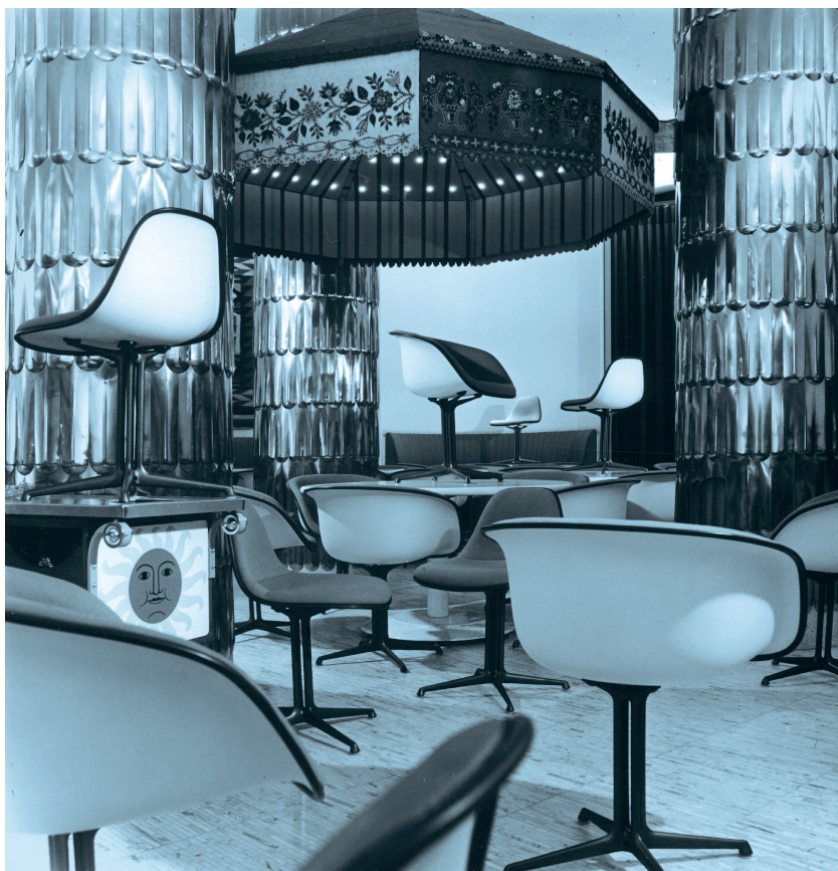
Le restaurant La Fonda del Sol, New York City, 1960.