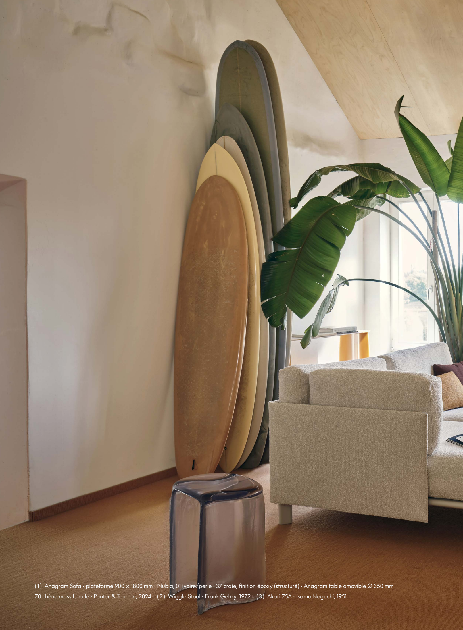
(1) Anagram Sofa · plateforme 900 x 1800 mm · Nubia, 01 ivoire/perle · 37 craie, finition époxy (structuré) · Anagram table amovible Ø 350 mm · 70 chêne massif, huilé · Panter & Tourron, 2024 (2) Wiggle Stool · Frank Gehry, 1972 (3) Akari 75A · Isamu Noguchi, 1951