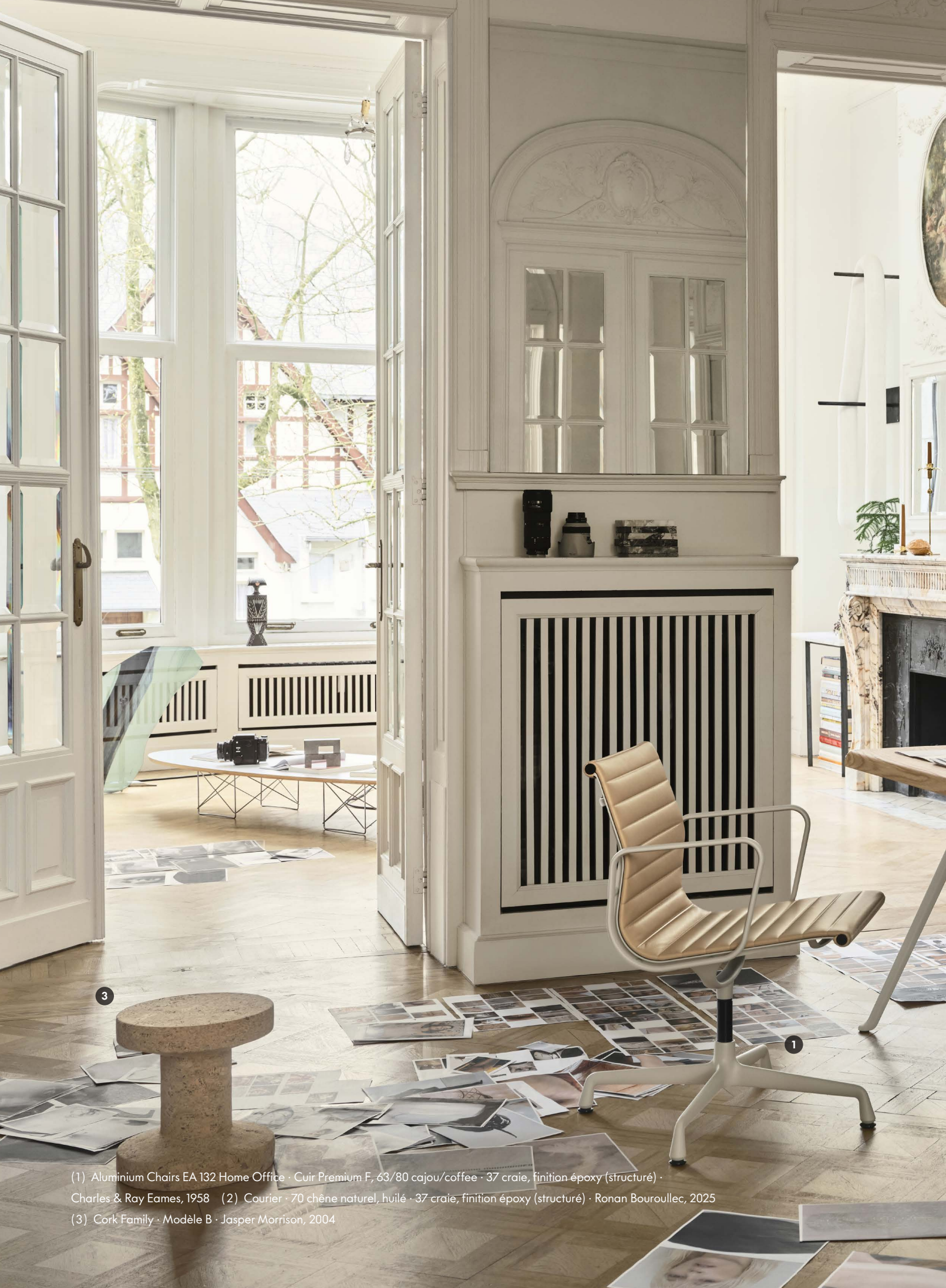
(1) Aluminium Chairs EA 132 Home Office · Cuir Premium F, 63/80 cajou/coffee · 37 craie, finition époxy (structuré) · Charles & Ray Eames, 1958 (2) Courier · 70 chêne naturel, huilé · 37 craie, finition époxy (structuré) · Ronan Bouroullec, 2025 (3) Cork Family · Modèle B · Jasper Morrison, 2004