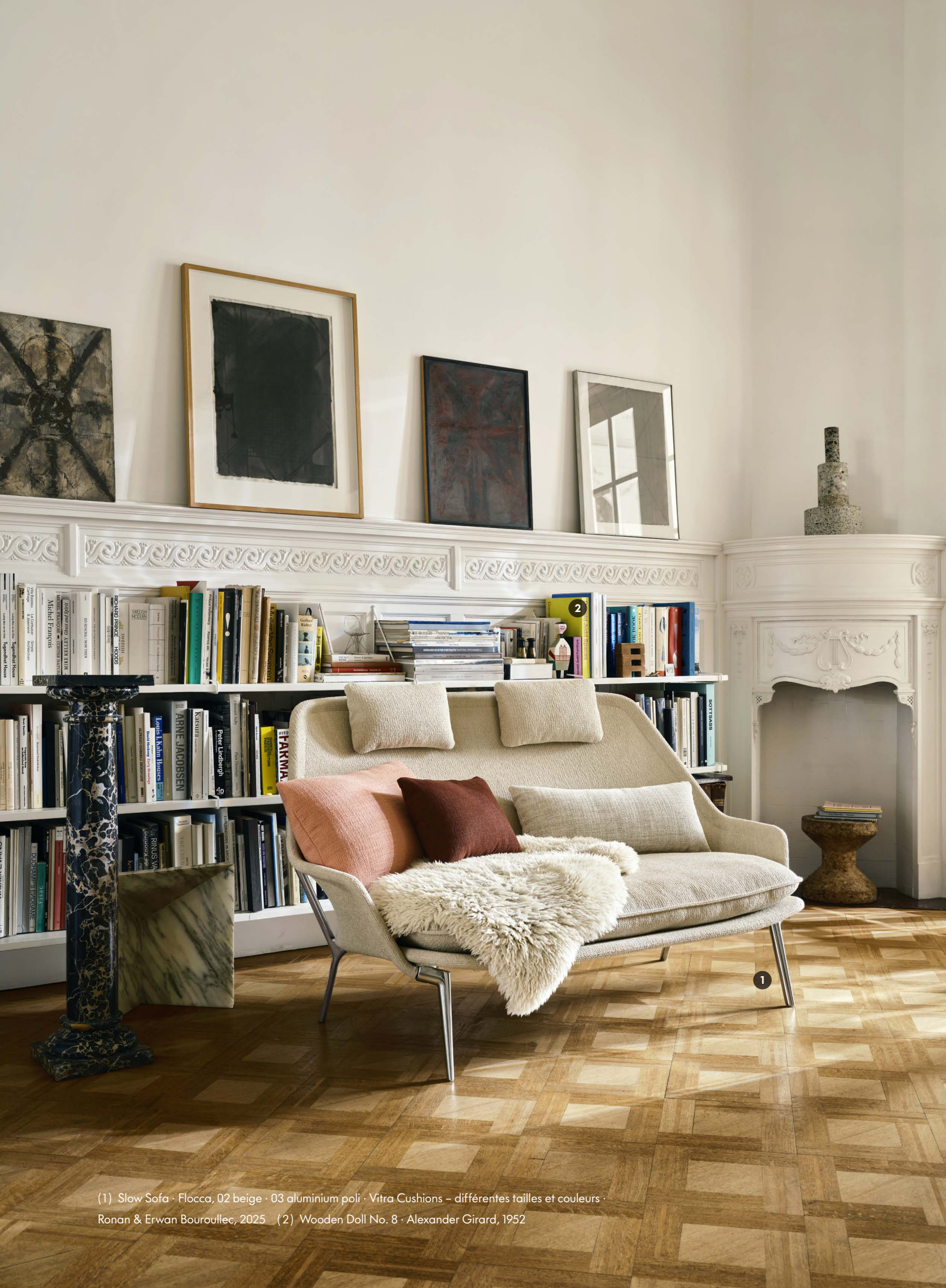
(1) Slow Sofa · Flocca, 02 beige · 03 aluminium poli · Vitra Cushions – différentes tailles et couleurs · Ronan & Erwan Bouroullec, 2025 (2) Wooden Doll No. 8 · Alexander Girard, 1952