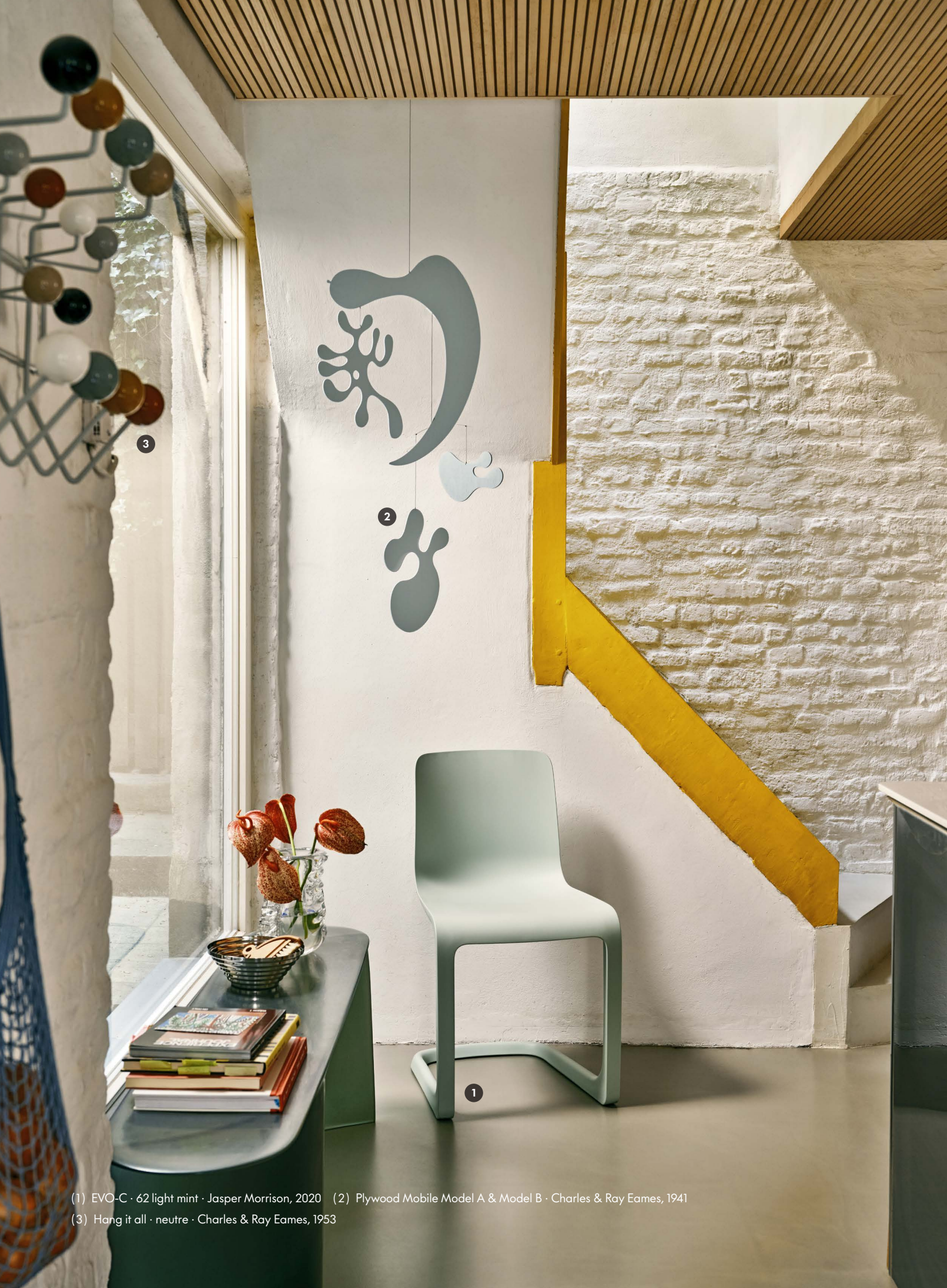
(1) EVO-C · 62 light mint · Jasper Morrison, 2020 (2) Plywood Mobile Model A & Model B · Charles & Ray Eames, 1941 (3) Hang it all · neutre · Charles & Ray Eames, 1953