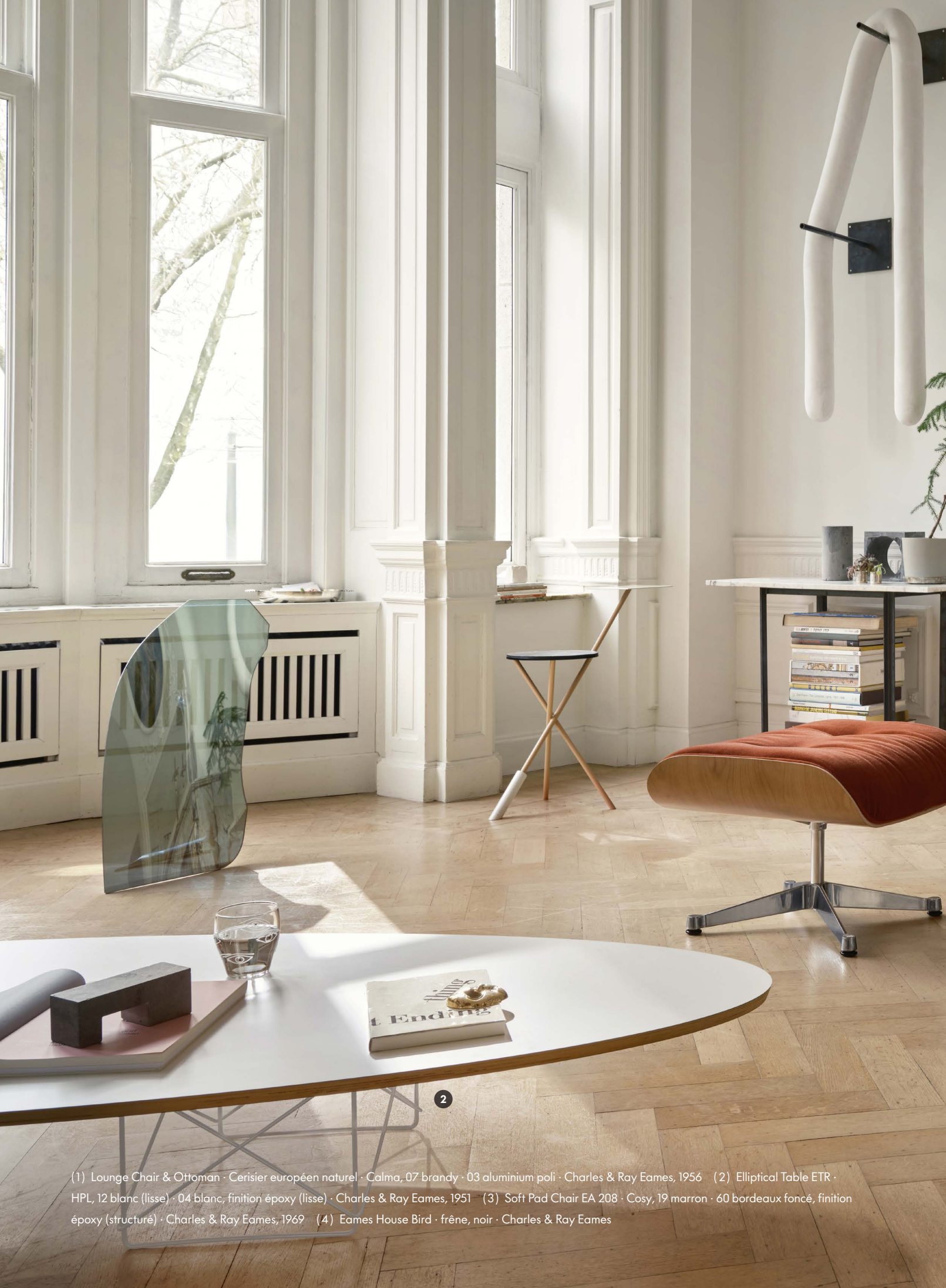
(1) Lounge Chair & Ottoman · Cerisier européen naturel · Calma, 07 brandy · 03 aluminium poli · Charles & Ray Eames, 1956 (2) Elliptical Table ETR · HPL, 12 blanc (lisse) · 04 blanc, finition époxy (lisse) · Charles & Ray Eames, 1951 (3) Soft Pad Chair EA 208 · Cosy, 19 marron · 60 bordeaux foncé, finition époxy (structuré) · Charles & Ray Eames, 1969 (4) Eames House Bird · frêne, noir · Charles & Ray Eames