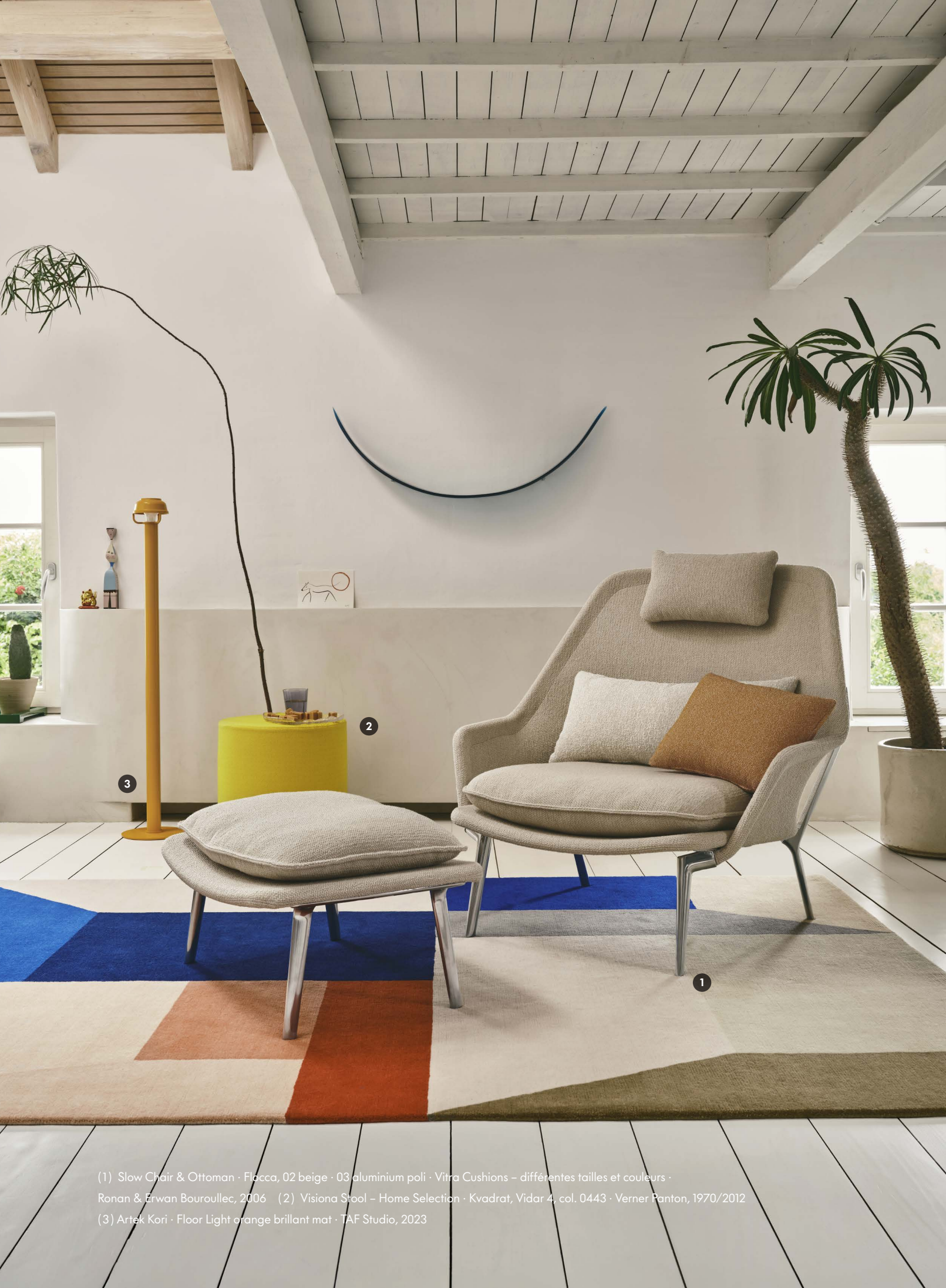
(1) Slow Chair & Ottoman · Flocca, 02 beige · 03 aluminium poli · Vitra Cushions – différentes tailles et couleurs · Ronan & Erwan Bouroullec, 2006 (2) Visiona Stool – Home Selection · Kvadrat, Vidar 4, col. 0443 · Verner Panton, 1970/2012 (3) Artek Kori · Floor Light orange brillant mat · TAF Studio, 2023