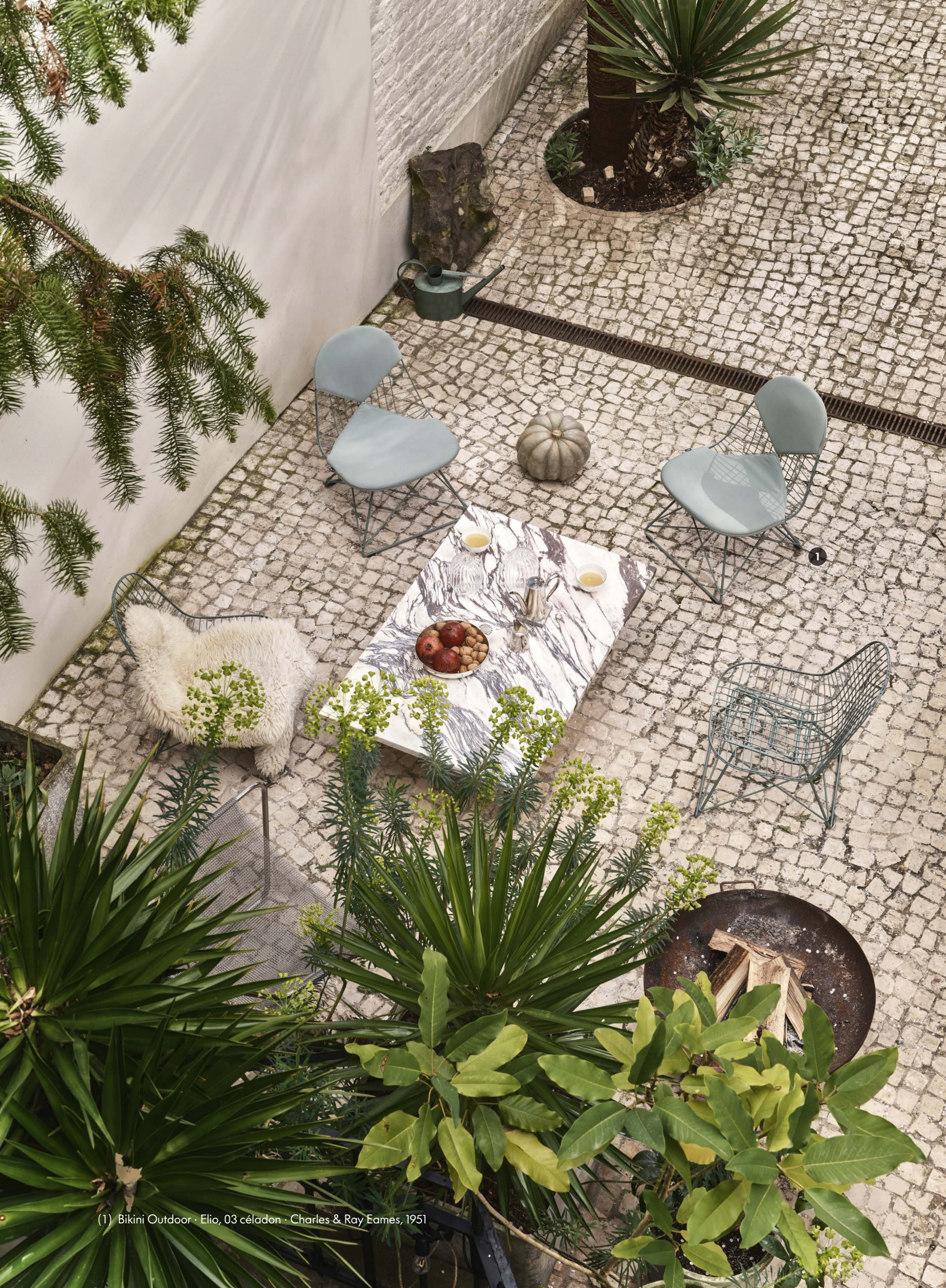
(1) Bikini Outdoor - Elio, 03 céladon - Charles & Ray Eames, 1951